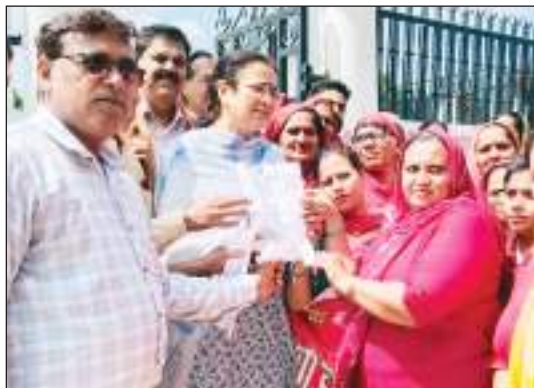
आशा वर्करों को मानदेय बहुत कम दिया जा रहा है। जिससे परिवार को गुजारा बड़ा मुश्किल से होता है।