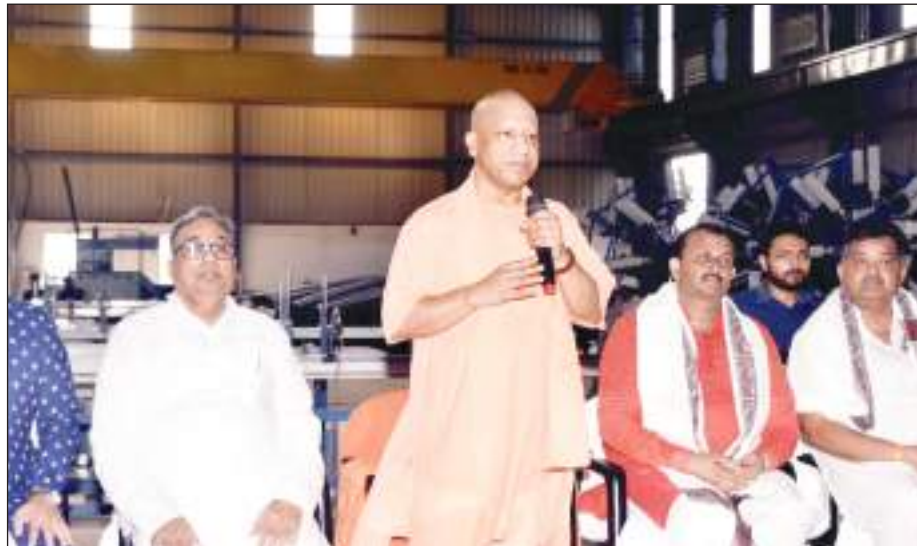
यूपी के मुख्यमंत्री योगी आदित्यनाथ सोमवार को जनपद गोरखपुर में प्लास्टिक पाइप निर्माण इकाई का उद्घाटन करते तथा कार्यक्रम को सम्बोधित करते हुये।

अनुमान है कि बारिश का ये दौर राजस्थान में आज और जारी रहेगा। 19 सितंबर से इसमें कमी आएगी और मौसम साफ होने लगेगा। मध्य प्रदेश के नीमच, रतलाम क्षेत्र में भारी बारिश के कारण ट्रेनों का संचालन बंद हो गया। राजस्थान के अलग-अलग शहरों से मुंबई के लिए इसी रास्ते से होकर गुजरने वाली करीब सात ट्रेनों का संचालन प्रभावित हुआ है। रेलवे को गाड़ी संख्या 22902 उदयपुर-बांद्रा टर्मिनस, गाड़ी संख्या 04711, बीकानेर-बांद्रा टर्मिनस, गाड़ी संख्या 12956 जयपुर-मुंबई सेंट्रल, गाड़ी संख्या 22901 बांद्रा-उदयपुर, गाड़ी संख्या 82654 जयपुर-यशवंतपुर और गाड़ी संख्या 12996 अजमेर-बांद्रा को रूट बदलकर चलाना पड़ा। इसके अलावा ट्रेनों संख्या 04712, बांद्रा टर्मिनस-बीकानेर स्पेशल ट्रेन को रद्द कर दिया। मौसम विभाग ने सोमवार को पश्चिमी राजस्थान के सिरोंही-जालोर जिले में भारी बारिश का अलर्ट दिया है। तेज बारिश के अलर्ट को देखते हुए जालोर और सांचौर कलेक्टर ने आज यहां स्कूलों में छुट्टी कर दी। मौसम विभाग ने इन दोनों जिलों के लिए आज ऑरेंज अलर्ट जारी किया है।