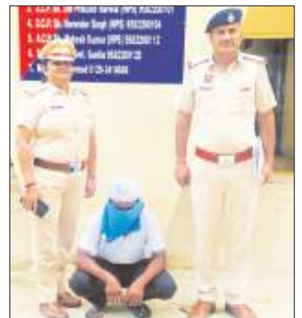
ने बताया कि वह 14 सितंबर को अपनी मां के साथ सखी लेने के लिए घर से बाहर गई थी। सखी लेने के पश्चात लड़की की मां ने